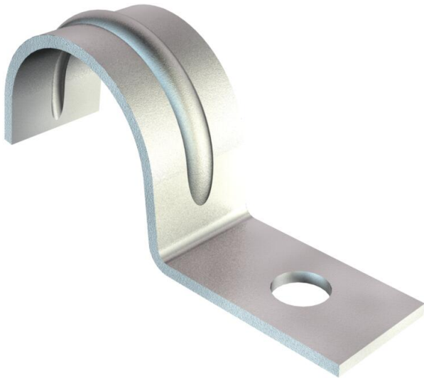
Grapa de una pata para cables y tubos