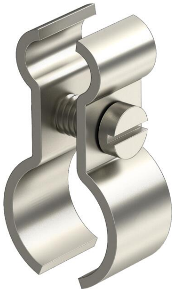
Abrazadera para cable tensor de 4-9 mm 14-18 mm Con tornillo V4A M4x14.