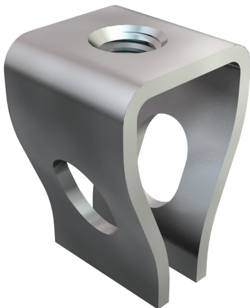
Soporte tipo Rabitz M8