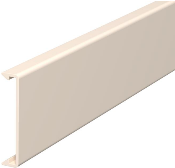
Tapa para cerrar los canales.