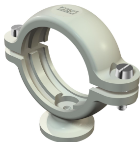
Grapa de zócalo ISO 25,5-28mm