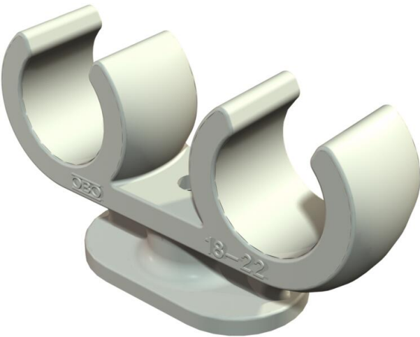
Abrazadera con zócalo 2 cables 10 mm