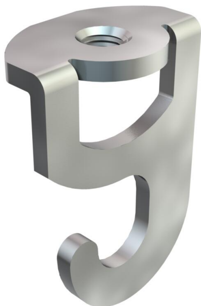
Gancho para techo TS con rosca métrica.