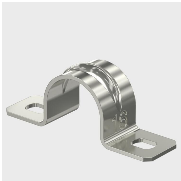
Grapas de dos pies para cables y tubos