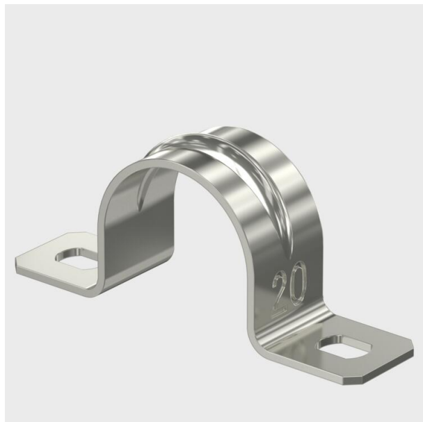
Grapas de dos pies para cables y tubos