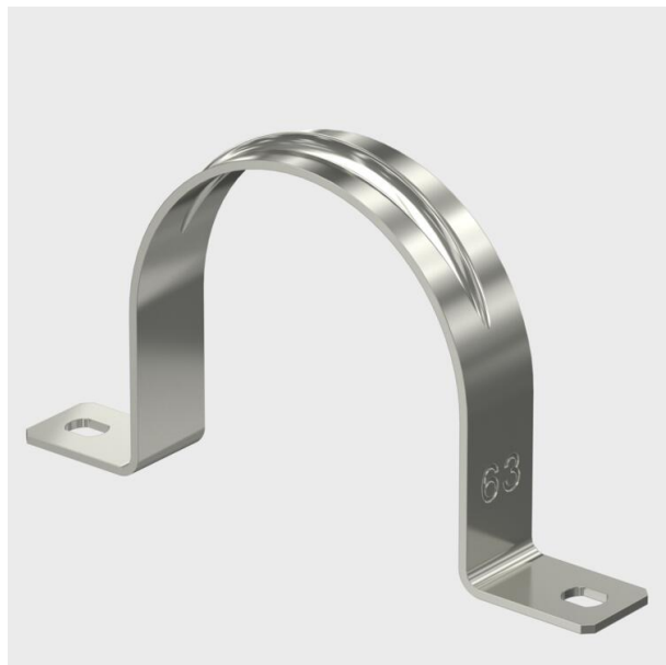
Grapas de dos pies para cables y tubos