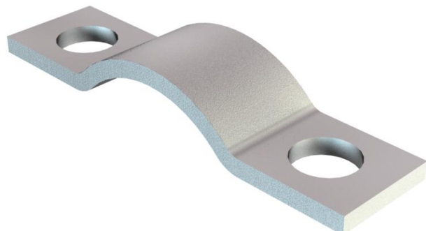
Brida de descarga de tracción 8 mm