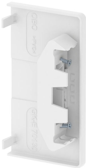
Pieza final para cerrar los canales portamecanismos.