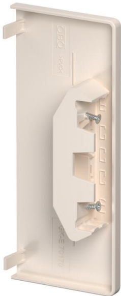
Pieza final para cerrar los canales portamecanismos.