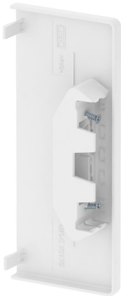
Pieza final para cerrar los canales portamecanismos.