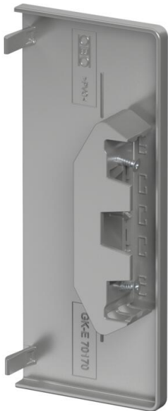
Pieza final para cerrar los canales portamecanismos.