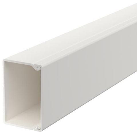
Tapa de canal y base con orificios.