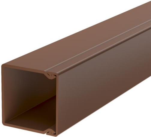
Tapa de canal y base con orificios.